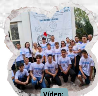
Vídeo: Cerimônia de Premiação

A Equipe Pedagógica, Direção, alunos e pais da E. E. Presidente Costa e Silva parabenizam a todos que contribuíram para este marco histórico, reafirmando o compromisso com o desenvolvimento de uma educação de qualidade.